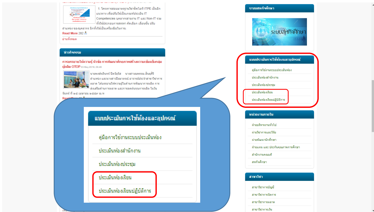
รูปที่ 3 ภาพตำแหน่งเมนูที่นักศึกษาต้องเข้าทำแบบประเมิน

3. โดยส่วนของนักศึกษาต้องเข้าทำการประเมิน ห้องเรียน และ ห้องปฏิบัติการ ที่นักศึกษาได้เข้าเรียนในภาคการศึกษาปัจจุบัน ทุกห้อง