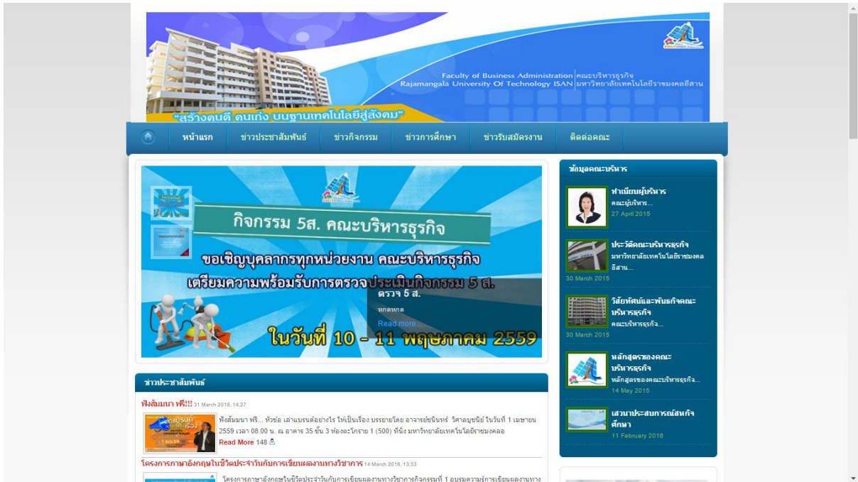
รูปที่ 1 ภาพหน้าเว็บไซต์คณะบริหารธุรกิจ

1. เข้ามาที่เว็บไซต์คณะบริหารธุรกิจ ที่ www.ba.rmuti.ac.th