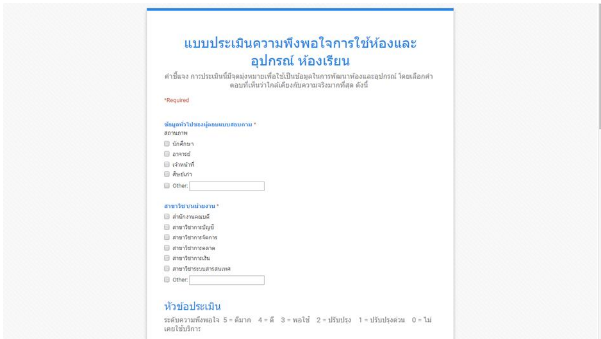
รูปที่ 4 ภาพแบบประเมินห้องเรียน/ห้องปฏิบัติการ

4. เมื่อคลิกเข้าเมนูประเมินห้องเรียน/ห้องปฏิบัติการ จะพบหน้าแบบ ดังนี้